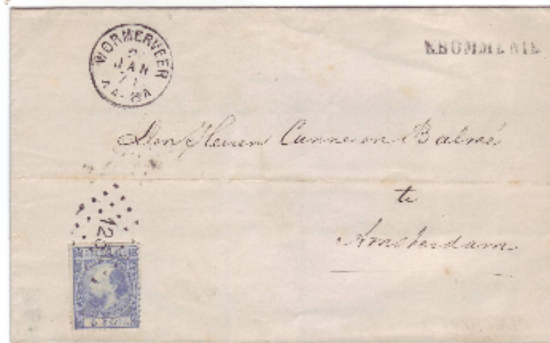
Puntstempels 128 (Zaandam) en 125 (Wormerveer)