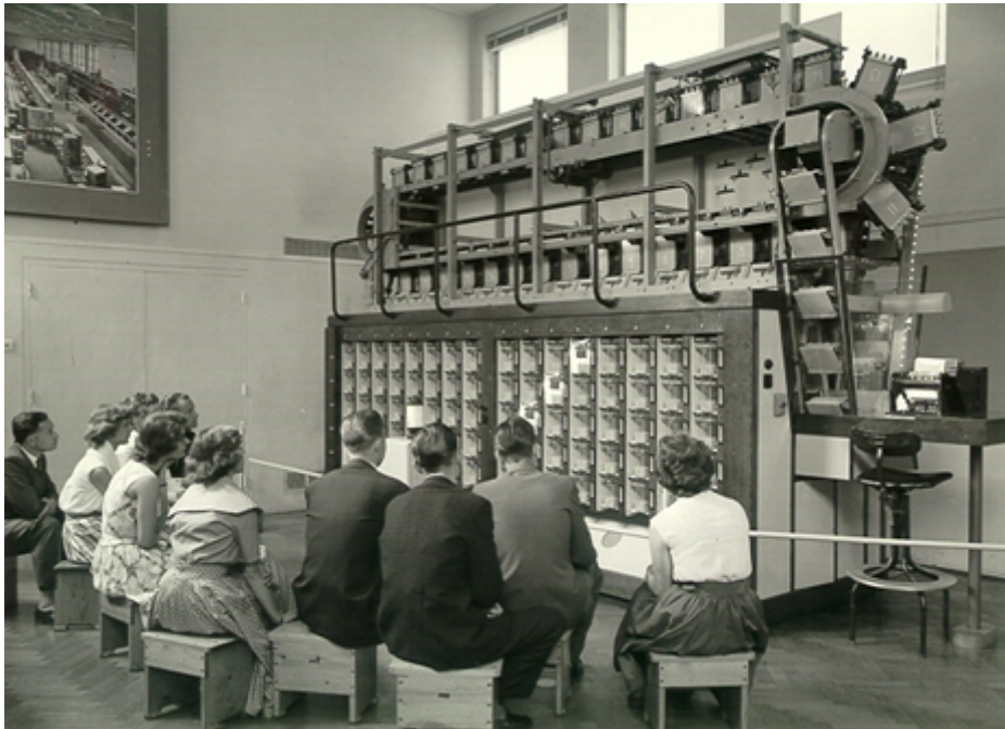
afbeelding Museum voor Communicatie